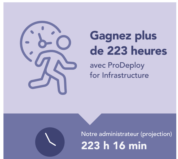
Figure 4 : Temps extrapolé, en heures et minutes, et étapes pour déployer 100 serveurs PowerEdge. Moins c’est mieux.