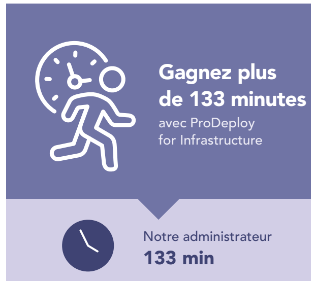
Figure 3 : Temps, en minutes, et étapes pour déployer un serveur PowerEdge unique. Moins c’est mieux.

ProDeploy peut également vous aider dans le cadre d’un déploiement de serveurs volumineux ou multiphases, en déployant les serveurs pour vous. Pour montrer combien de temps une entreprise pourrait gagner en utilisant ProDeploy for Infrastructure sur une installation de serveur à grande échelle, nous avons extrapolé à 100 serveurs les minutages capturés lors du déploiement d’un serveur Dell PowerEdge R750 unique. Comme le montre la figure 4, laisser un ingénieur agréé Dell déployer 100 serveurs PowerEdge pour vous pourrait vous faire gagner plus de 223 heures par rapport à demander à un administrateur interne de les déployer.